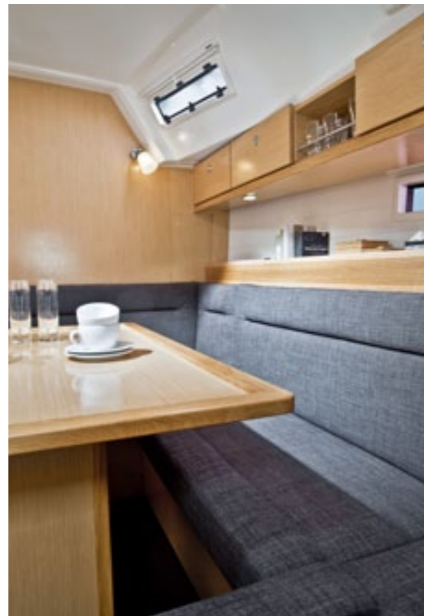
Steuerbord: U-Sofagruppe mit fester Sitzbank. Starboard: U-shaped settee with mounted seating bench.