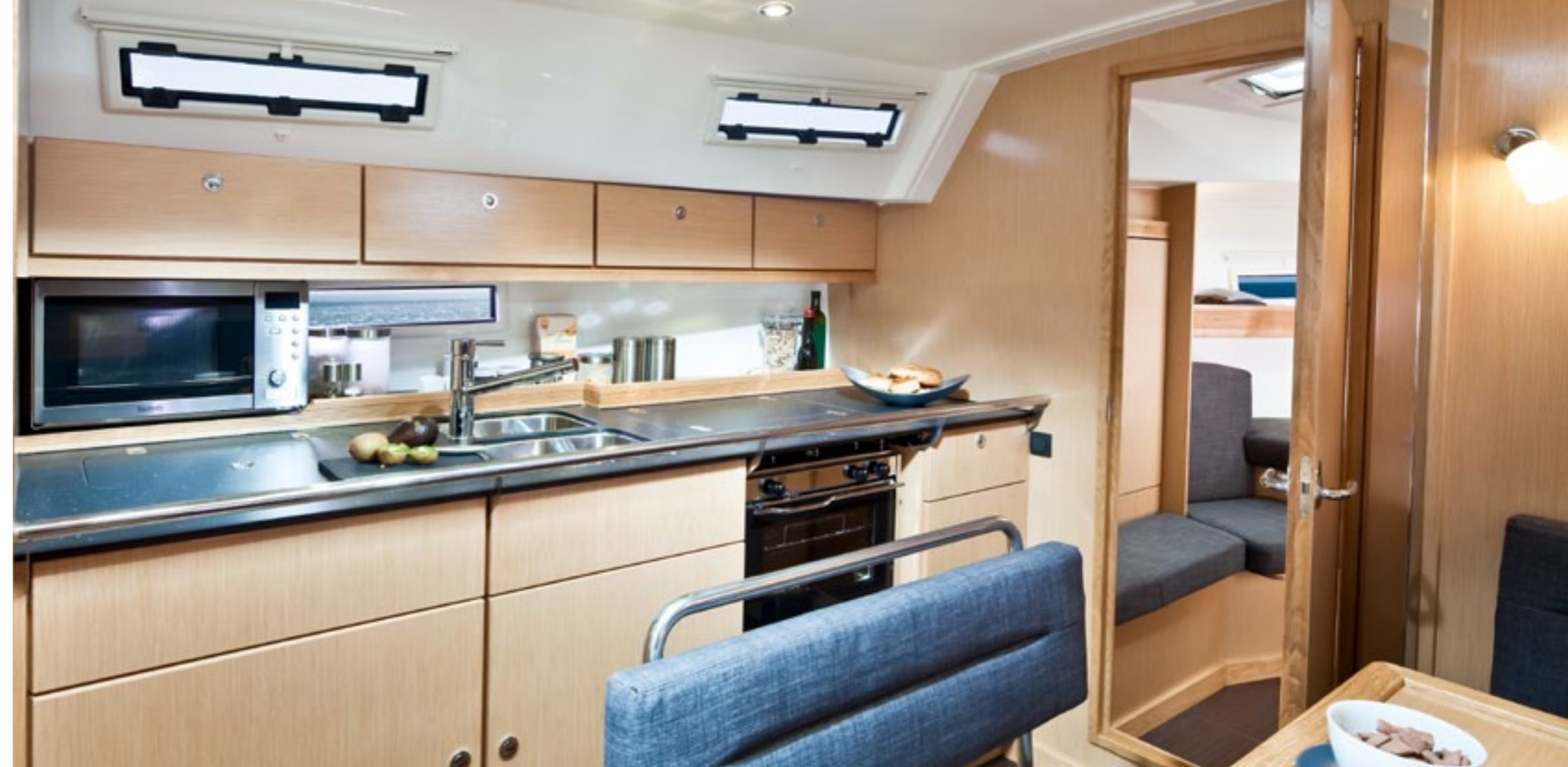
Die lange Küchenzeile verfügt über eine große Arbeitsfläche, eine Eisbox und einen Gasherd mit Backofen. Und es bleibt noch immer reichlich Stauraum und genügend Platz, um zum Beispiel eine Mikrowelle zu integrieren. The long kitchenette offers a large working top, an ice box and a gas stove with oven. And there is still plenty of stowage and space to integrate a microwave, for example.