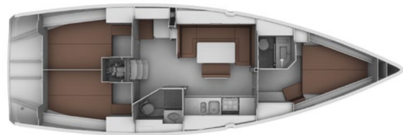
Das Interieur./The Interior.