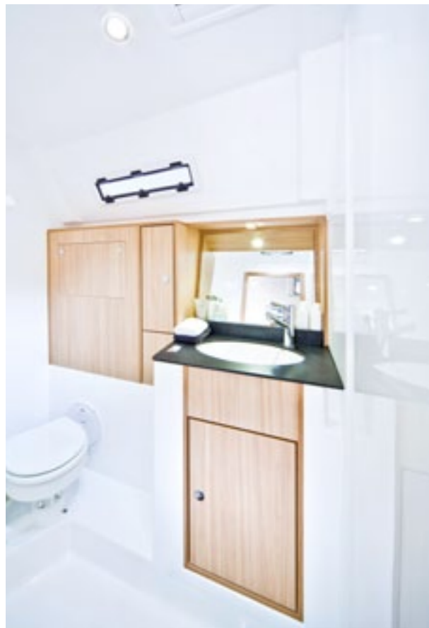
Backbord: Nasszelle mit Duschtrennung zum Waschtisch. Port side: Wetroom with shower separation to toilet.