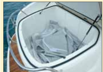
Por popa y bajo la colchoneta, obtendremos un excelente espacio de estiba.