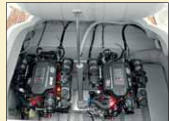
Al levantar toda la tapa que cubre el solárium de popa, accederemos a la instalación de los dos motores Volvo 4.3 de 225 CV cada uno.